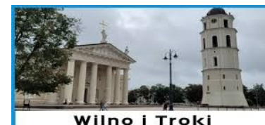
Wilno i Troki